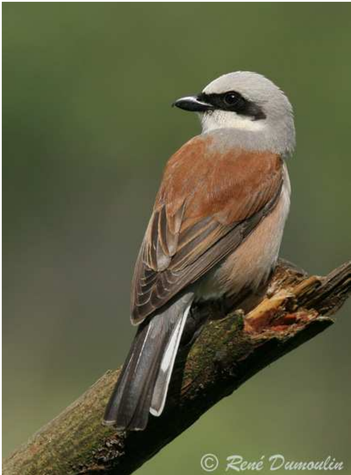
Pie-grièche écorcheur ( Lanius collurio ).