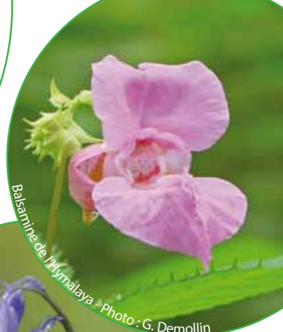
Balsamine de l'Himalaya - Photo : G. Demollin

Peu étonnant qu'elle soit appréciée dans les jardins pour ses propriétés ornementales ! Mais alors que la balsamine de l'Himalaya , avec ses belles fleurs roses, séduit plus d'un amateur bleu d'horticulture, elle fait virer au rouge ou au blanc pâle les amoureux de la nature originelle ! Cette plante venue d'ailleurs et introduite sur le territoire, envahit de façon parfois fulgurante l'espace et ceci, au détriment des plantes indigènes ! L'expansion de ce type d'espèces défavorables pour la biodiversité est également une problématique dont il est tenu compte en site Natura 2000.