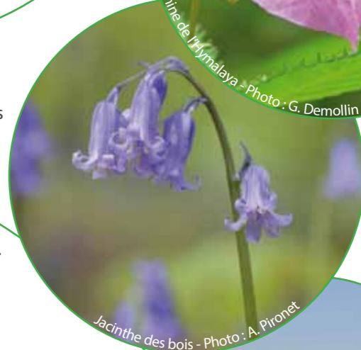
Jacinthe des bois

Au printemps, la jacinthe des bois abonde en sous-bois de cette de forêt composée de chênes, charmes, érables et autres. Dessinant des tapis denses d'inflorescences en forme de clochettes bleu-mauve, cette espèce ravira les yeux des promeneurs avides de couleur, délaissant momentanément du regard le sobre mais grand scirpe des bois, les discrètes anémones sylvie et l'original sceau de Salomon, qui attendront la fin du printemps pour se faire remarquer.