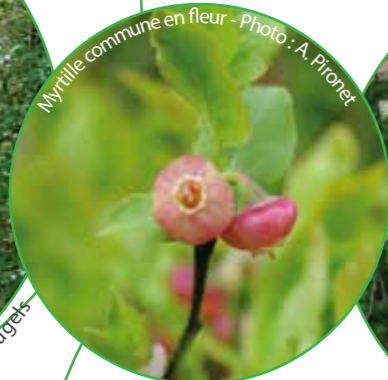
Myrtille commune en fleur