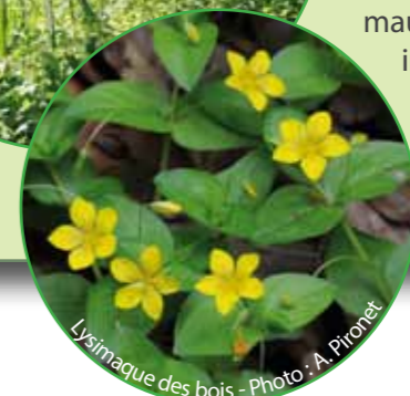
Lysimaque des bois

L'Arche asbl est un refuge animalier pour les animaux domestiques mais c'est aussi un centre de revalidation pour animaux sauvages, qu'ils soient indigènes ou exotiques (CREAVES - LRPO). Allée du Traynoy, 14a 1470 Bousval. 010/61.75.29 - www.larche-asbl.be