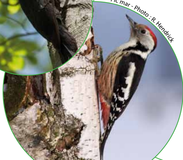
Pic mar