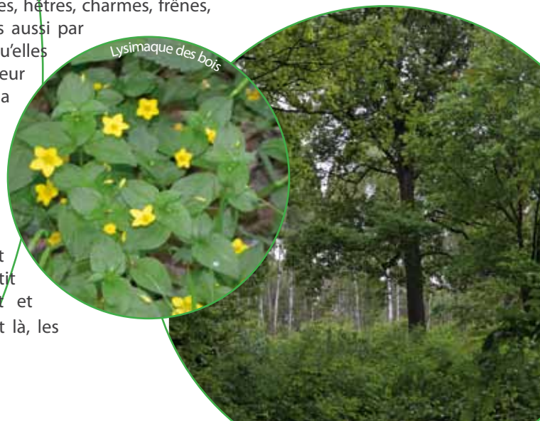
Lysimaque des bois

Belle dénomination pour ces forêts abritant divers feuillus bien de chez nous ! Certes, elles sont intéressantes par la diversité d'essences qu'elles renferment : chênes, hêtres, charmes, frênes, noisetiers ou encore érables ..., mais aussi par les espèces rares et/ou menacées qu'elles abritent, tels les pics, noir et mar. Leur intérêt biologique réside aussi dans la variété de ses « habitants plus ordinaires » que vous aurez probablement l'occasion d'observer: sittelle torche-pot, rouge-gorge, et autres petits animaux familiers tels l'écureuil roux. Quelques plages de muguet et de maianthème, appelé également petit muguet, mais aussi d'herbe à Robert et de lysimaque des bois colorent, ci et là, les sous-bois variés de ces forêts.