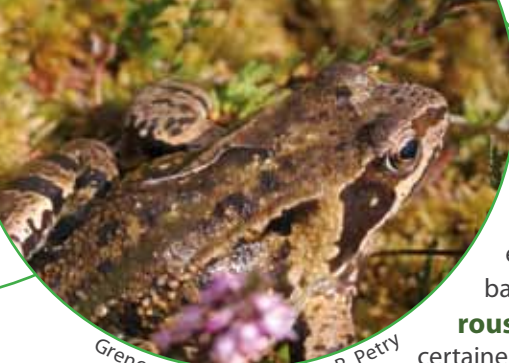
Grenouille rousse