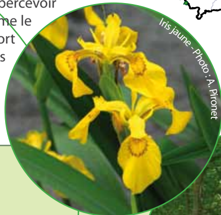
Iris jaune - Photo: A. Pironet

Natura 2000 en Province du Brabant Wallon