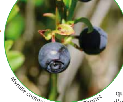
Myrtille commune

Ce schéma est donné à titre indicatif et ne remplace pas une carte de terrain.