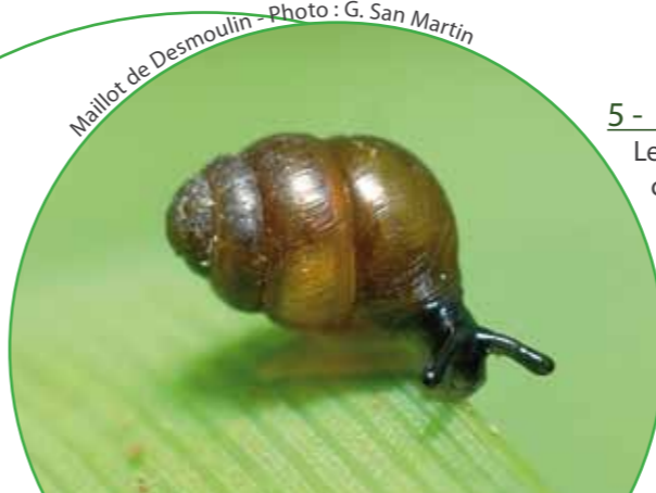
Maillot de Desmoulin