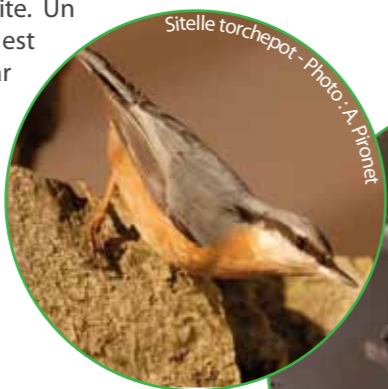
Sittelle torchepot

Grimpereaux des jardins , sitelles torchepot ou encore fauvettes à tête noire sont des espèces forestières assez communes et bien présentes sur le site. Un peu plus loin, la présence de vieux chênes est propice au pic mar, un oiseau protégé par Natura 2000 mais celui-ci se tient à l'abri de l'affluence humaine tandis que le geai des chênes, qui, lui, semble être habitué à ses admirateurs, est généralement visible des chemins.