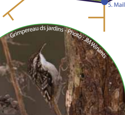
Grimpereau ds jardins